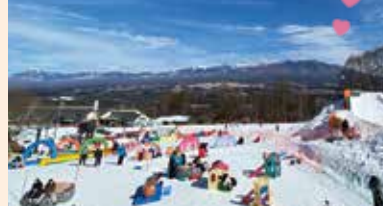
▲プラスチックスキー滑走エリアあり ▲人気のチューピング