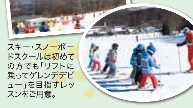
スキー・スノーボードスクールは初めての方でも「リフトに乗ってゲレンデデビュー」を目指すレッスンをご用意。

ファミリーゲレンデ、センターゲレンデは、ゆっくり動く「安心リフト」。スタッフがリフトの乗り降りをサポート。