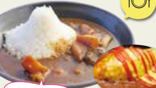
ふじてん名物「富士山カレー」