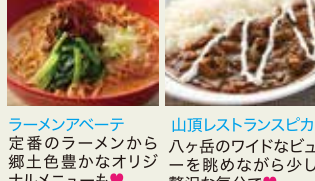
山頂レストランスピカ ハケ岳のワイドなビューを眺めながら少し贅沢な気分♡