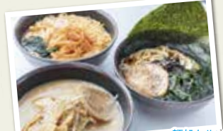
麺処ケレン オリジナルラーメンなど種類を中心としたメニューをご用意。