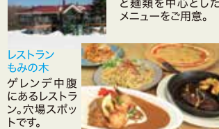
レストランもみの木 ゲレンデ中腹にあるレストラン。穴場スポットです。

☎0555-85-2000 https://www.fujiten.net 山梨県南都留郡鳴沢村富士山8545-1