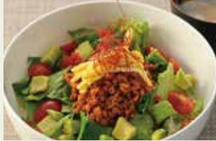
山麓レストランオリオン 定番メニューはもちろん信州ならではの当地メニューも♡