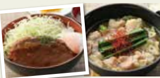
ラーメンアベテ 定番のラーメンから郷土色豊かなオリジナルメニューも♡