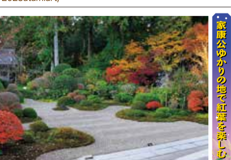
家康公ゆかりの地で紅葉を楽しむ

熱海の街はもろもろ、海や山も舞台に展開する熱海芸術祭は、熱海を中心に活動するアーティストの多彩な作品を楽しむアートイベント。未知なる音楽へ誘う刺激的な音楽祭「ファンタジー」童話の世界、アーティストの制作発表、怪獣映画の上映やトークなど、様々なジャンルのイベントが展開される。秋の熱海で温泉に浸かりながらアートを楽しむ。